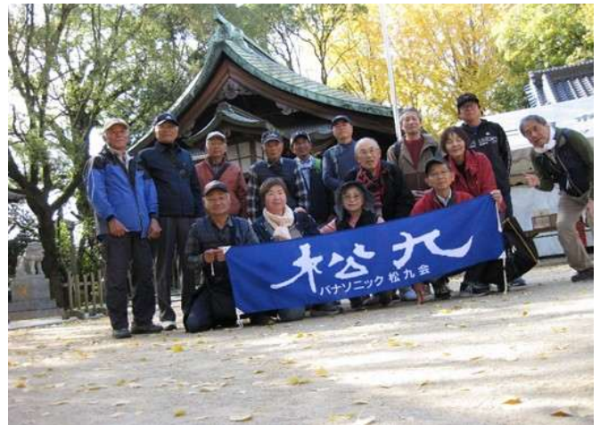
集合写真②(二日市八幡宮)