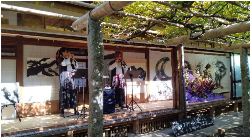
オカリナ ライブ(武蔵寺)