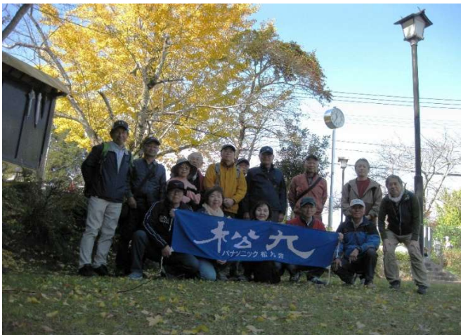
集合写真①(天拝山歴史自然公園)