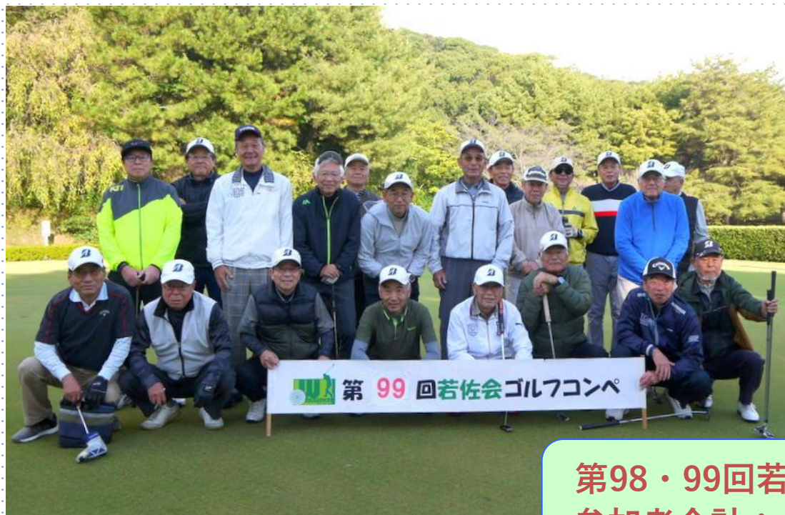
第 99 回若佐会ゴルフコンペ